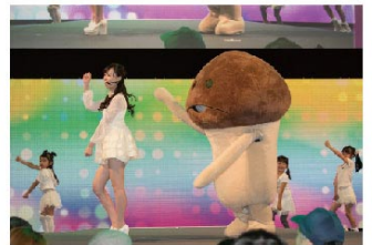
ステージでは「なめこリズム」を初体験したほか、サプライズで「なめこのうた」も披露。

——今回遊んだ「なめこリズム」には普通のなめこしか出てこなかったんですが、2回タッチする双子なめこや、長くタッチする長なめこが出てくるモードにもチャレンジしたかったです。 ——ちなみに自身の歌声で「なめこリズム」をプレイするのはどんな感覚なんですか? ——「なめこリズム」に収録される20曲以上の中で、「この曲にチャレンジしたい!」という曲はありますか。 ——デレモン閣下の「地獄のなめこのうた」です。 ——キャラのコスチュームを着せ替えることができる「へんそう」モードもありますが、モデルとして活躍している遥ちゃんのおすすめて教えてください。 ——りなちゃんに似せてるなめこデザインのコスチュームです! 茶色のバルーンスカートがかわいい! ——さいごに「なめこのうた」のフアンの皆様メッセージをお願いします。