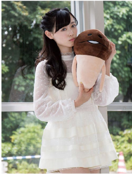
Profile 1998年8月28日生まれ/おとめ座/A型/埼玉県出身 小学校1年生で子役デビュー。NHK Eテレビの「クッキンアイドル アイ!マイ!まいん!」の柊まいん役で一躍人気に。現在は「ピチレモン」専属モデルとして活躍中。