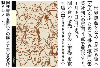
会参加には整理券が必要) 【整理券配布期間】10月9日(木)10時~10月12日(日)14時 【サイン会実施時間】10月11日(土)15時~19時、10月12日(日)10時~15時 ④ 「なめこ」世界遺産原画展 世界遺産をなめこが巡る絵本「んふんふん」なめこで世界遺産(集英社刊)の原画4点を展示する。10月19日(日)まで。問い合わせ先「なめこ市場 東京本店」(03-6256-0998) 関連書籍2冊以上の購入でもらえる特製A5ノート。